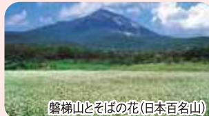
磐梯山とそばの花(日本百名山)

磐梯町農業公社 新鮮野菜 「会津磐梯山と名水のまち」 福島県磐梯町から、環境保全にこだわった新鮮野菜をお届けします。